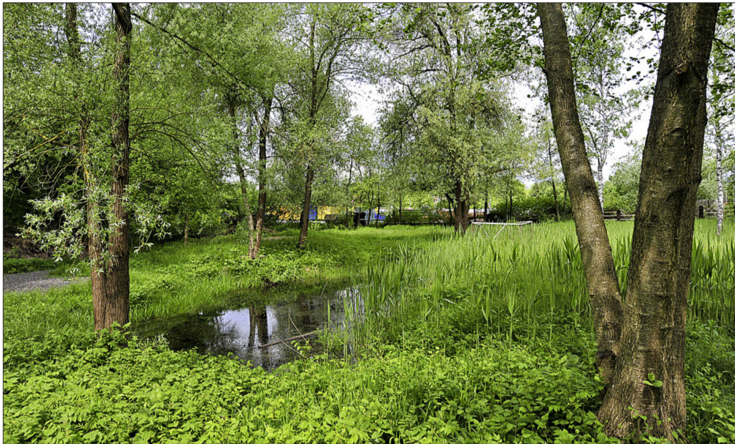
Kleinod mitten in Langenthal: Das Biotop an der Weissensteinstrasse soll verschwinden. Der Tennisclub will bauen.

Es herrscht Alarmstufe Rot im Quartier. Seit bekannt ist, dass die Stadt das Biotop an der Weissensteinstrasse (gegenüber der Privatklinik SGM) aufheben will und das Land im Baurecht für eine Tennisanlage zur Verfügung stellen möchte, wird der Widerstand immer heftiger. Auf Flugblättern, Plakaten und in Leserbriefen machen die Anwohner ihrem Ärger Luft. «Dieses Biotop